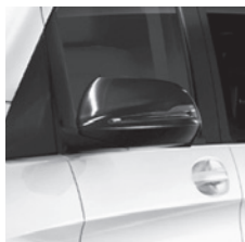
Fahrzeugspiegel in schwarz lackiert (F3S)