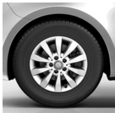
40,6 cm (16") Leichtmetallräder, vanadiumsilber lackiert, mit Bereifung 205/65 R 16 (RL5) 1