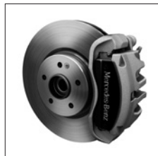
43,2 cm (17") Bremsanlage an der VA und Bremsattel mit »Mercedes-Benz« Schriftzug (BS1)