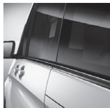
Bordkantenzierstab schwarz (FK5)