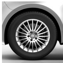
43,2 cm (17") Leichtmetallräder, vanadiumsilber lackiert, mit Bereifung 225/55 R 17 (RK8)