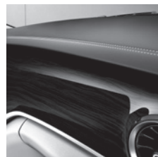
Instrumententafel in Leder- optik mit Ziernaht (FH6) und Zierelemente Holzoptik Eben- holz, dunkelanthrazit (FH9)