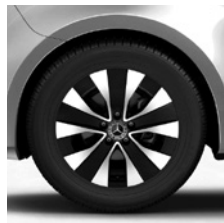
43,2 cm (17") Leichtmetallräder, schwarz, glanzgedreht, mit Bereifung 225/55 R 17 (R1N)