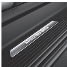
Schriftzug Einstieg »Mercedes-Benz« beleuchtet (C74)