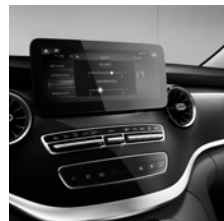
Zielerlemente Carbonoptik (FB1) und Sportpedalanlage (YF3)