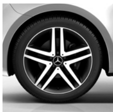
48,3 cm (19") Leichtmetallräder, schwarz lackiert, Front glanzgedreht, mit Bereifung 245/45 R 19 (RL3)