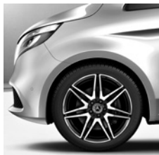
Sportfahrwerk (CF8) (Optional: AGILITY CONTROL Fahrwerk (CA1))