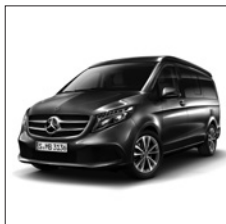
Sportfahrwerk (CF8) (Optional: AGILITY CONTROL Fahrwerk (CA1))