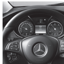
Multifunktionslenkrad beledert (CL3)