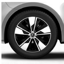
45,7 cm (18") Leichtmetallräder, schwarz, glanzgedreht, mit Bereifung 245/45 R 18 (R1P)