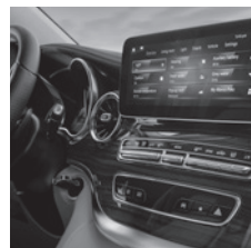
Ambientebeleuchtung (LC1), Cockpit und Fond