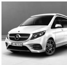
AMG Frontschürze und AMG Seitenschwellerverkleidungen