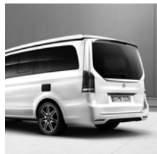
AMG Heckschürze und AMG Abrisskante (FB4)