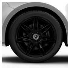
48,3 cm (19") AMG Leichtmetallräder, schwarz, mit Bereifung 245/45 R 19 (R1U)