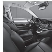
Leder Nappa schwarz (VY7) oder tartufo (V4T) oder seidenbeige (VY9)