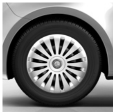
43,2 cm (17") Stahlräder (Serie für 140 kW) (RS7)