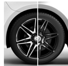
Wahlweise (RK4/R1U): 48,3 cm (19") AMG Leichtmetallräder im 7-Doppel- speichen-Design (RK4/R1U)