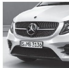
AMG Frontstoßfänger mit Zier- elementen in schwarz (C1L) 2