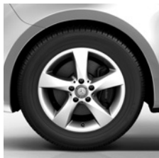
43,2 cm (17") Leichtmetallräder, vanadiumsilber lackiert, mit Bereifung 225/55 R 17 (RL8)