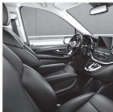
Leder Lugano schwarz Marco Polo (VU0)