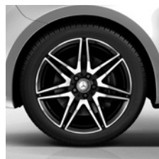
48,3 cm (19") AMG Leichtmetallräder, schwarz, glanzgedreht, mit Bereifung 245/45 R 19 (RK4)