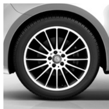
48,3 cm (19") Leichtmetallräder, schwarz lackiert, Front glanzgedreht, mit Bereifung 245/45 R 19 (RK3)