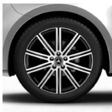
48,3 cm (19") Leichtmetallräder, schwarz, glanzgedreht, mit Bereifung 245/45 R 19 (R1Q)