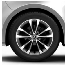
45,7 cm (18") Leichtmetallräder, tremolitgrau, glanzgedreht, mit Bereifung 245/45 R 18 (R1O)