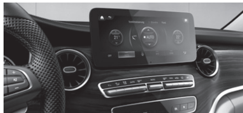
Zierelemente Holzoptik Ebenholz, dunkelanthrazit (FH9) od. opt. Klavierlackoptik schwarz (FH0) od. opt. Doppelstreifenoptik (F2Z) 1