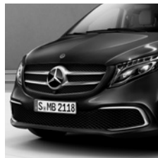
Stoßfänger mit Chromeinlage vorn (CM6)