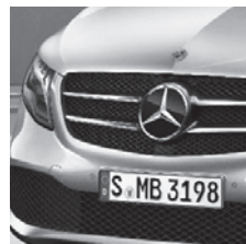
Kühlergrill schwarz lackiert (FK4)